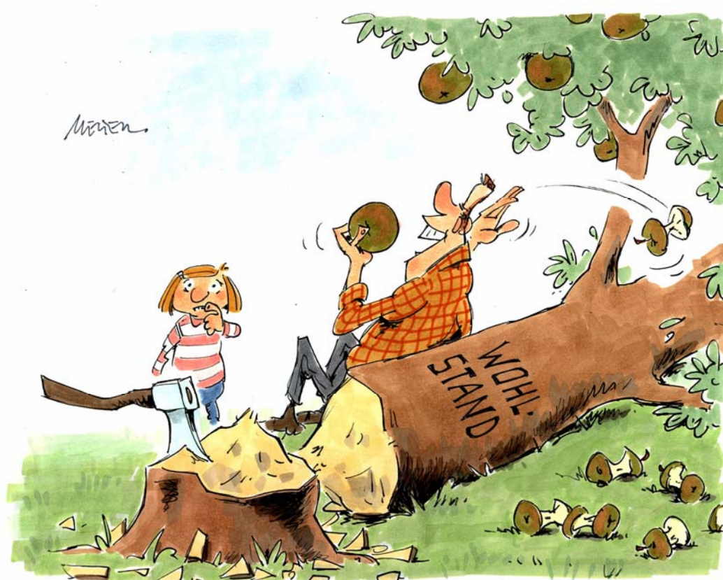
Karikatur: Gerhard Mester