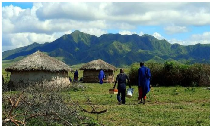
Maasai leben im Einklang mit Natur und Umwelt - wenn sie nicht vertrieben werden.